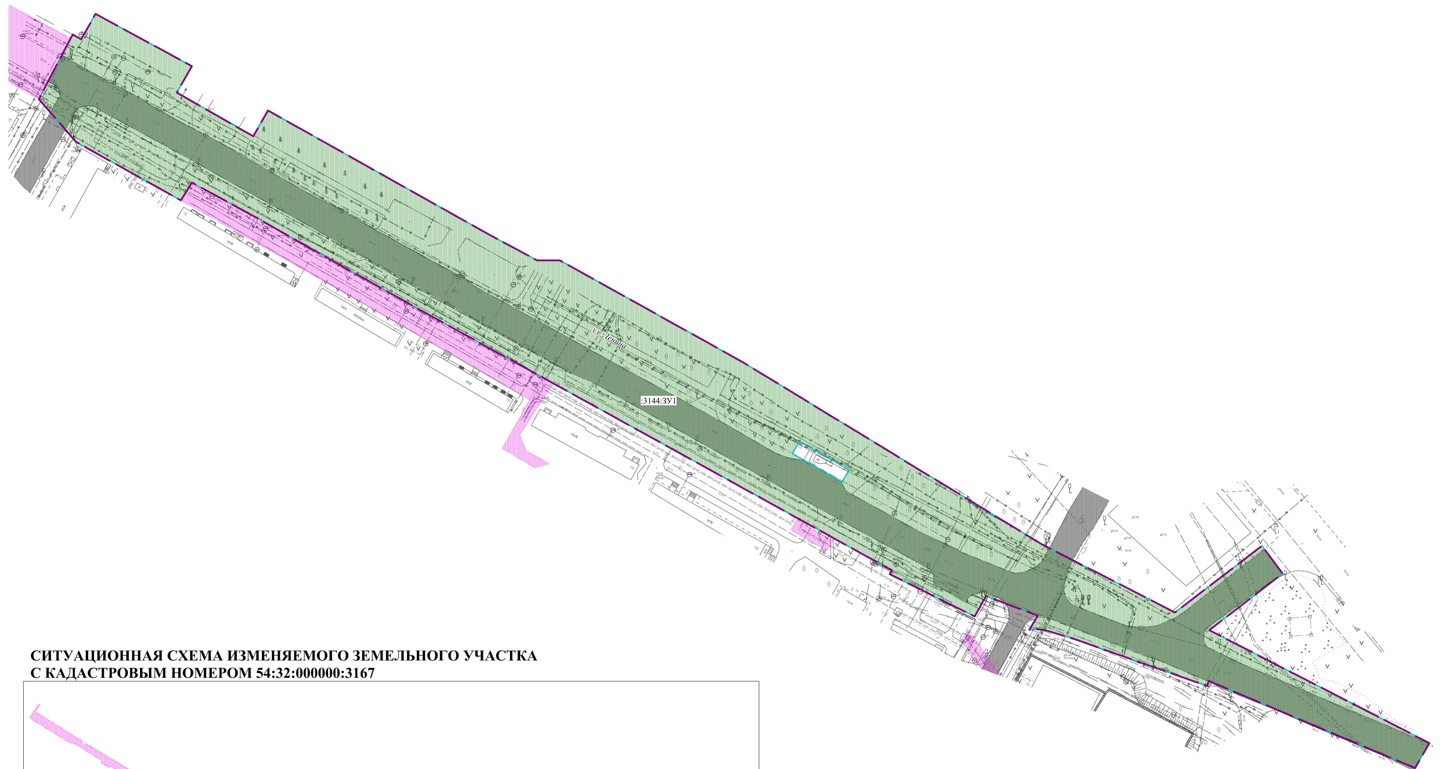
СИТУАЦИОННАЯ СХЕМА ИЗМЕНЯЕМОГО ЗЕМЕЛЬНОГО УЧАСТКА С КАДАСТРОВЫМ НОМЕРОМ 54:32:000000:3167