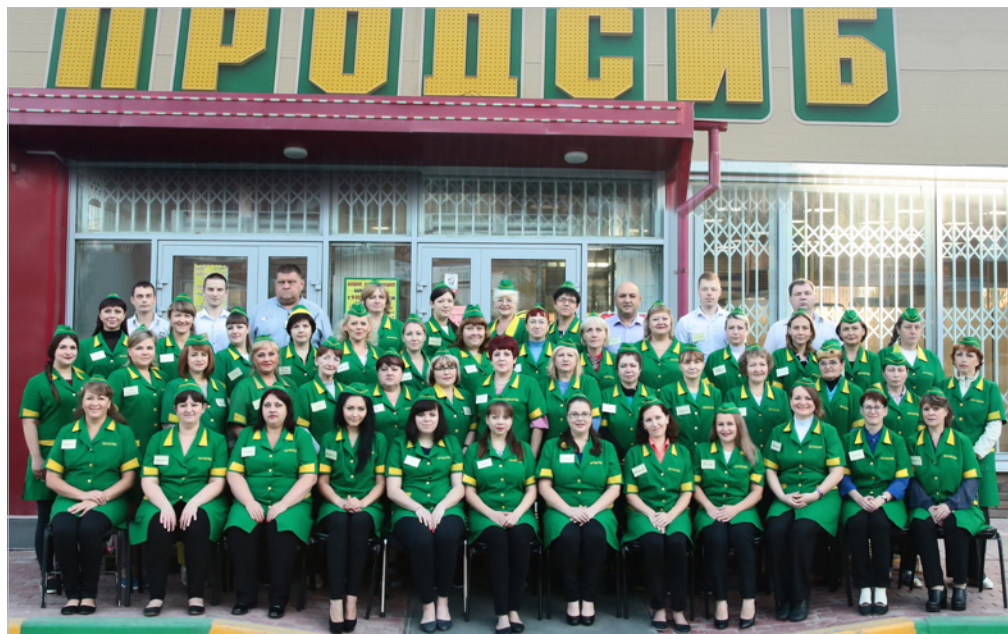
Коллектив супермаркета № 21 Производственно-коммерческого холдинга «ПродСиб»

Благодаря накопленным традициям, внедрению инновационных практик и партнерским взаимоотношениям с социумом, учреждение является одним из флагманов дошкольного образования города.