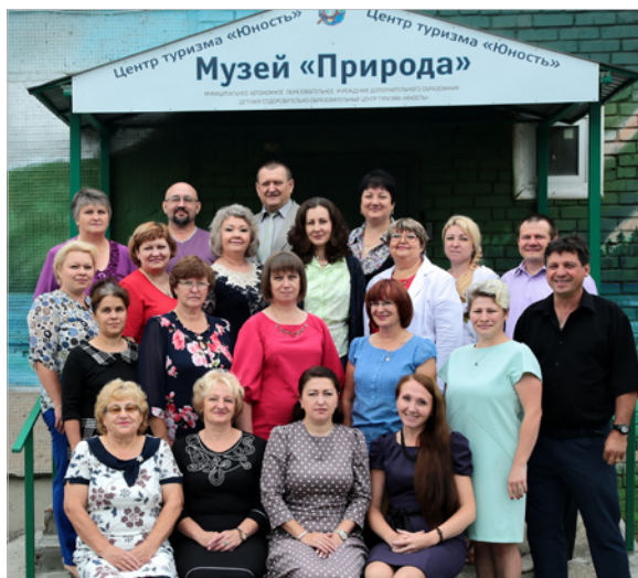
Коллектив МАОУДО «Детский оздоровительно-образовательный центр туризма «Юность»

Обладатель многочисленных наград международного, всероссийского и областного уровней. Украшение любого праздничного и торжественного мероприятия.