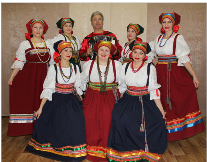
Народный коллектив Фольклорный ансамбль «Берегиня»

старший государственный налоговый инспектор отдела урегулирования задолженности и обеспечения процедур банкротства Межрайонная ИФНС России № 3 по Новосибирской области Грамотный и высококвалифицированный инспектор, обеспечивающий качественное проведение процедур банкротства предприятий. Опыт работы — 25 лет.