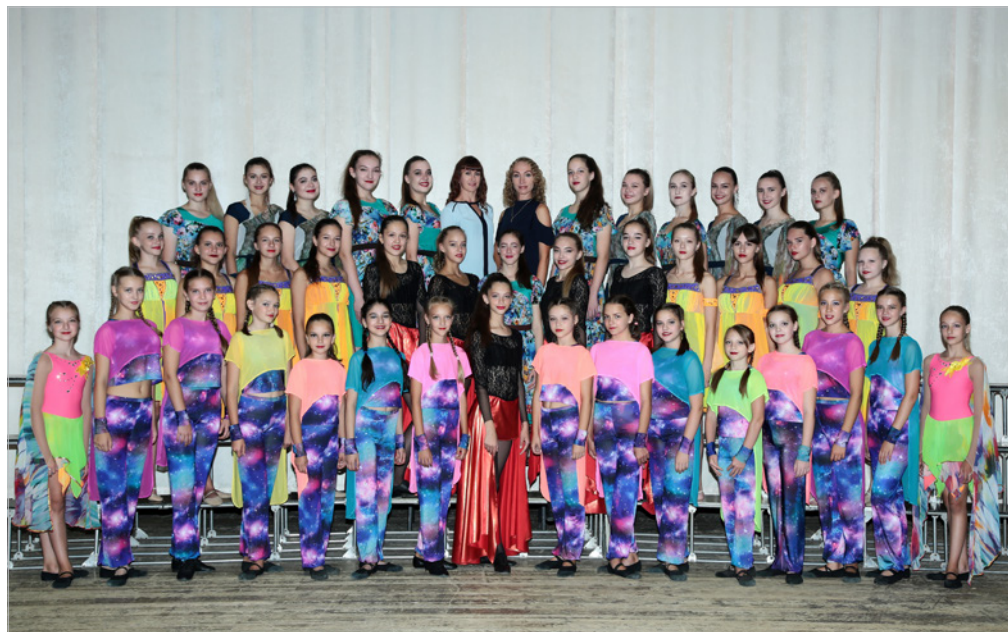
Образцовый коллектив хореографический ансамбль «Арабески» МАУ «Дворец культуры «Родина»

Коллектив педиатрического отделения оказывает квалифицированную медицинскую помощь, как специализированную, так и неотложную, в круглосуточном режиме.